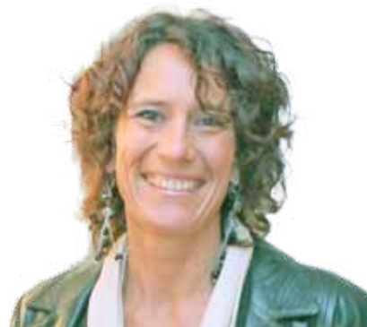
Madame le Maire

Maire de Saint Mitre les Remparts Vice-présidente de la CAPM