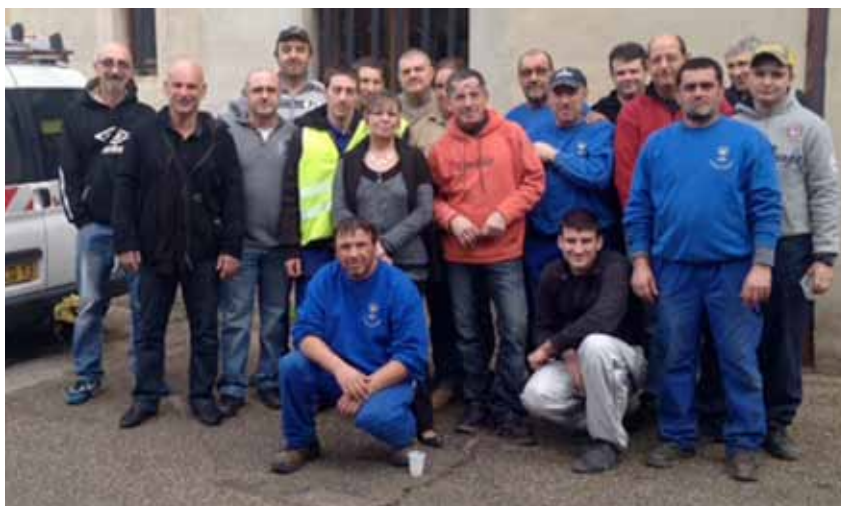
Les services techniques, c'est aujourd'hui une équipe de 23 employés municipaux au service de la population.

Originaire de la Charente, il est arrivé dans notre région en 1996. Fort de ses expériences acquises dans l'ingénierie électrique chez Eurocopter (Marignane) ainsi que dans la gestion et le suivi de l'atelier mécanique