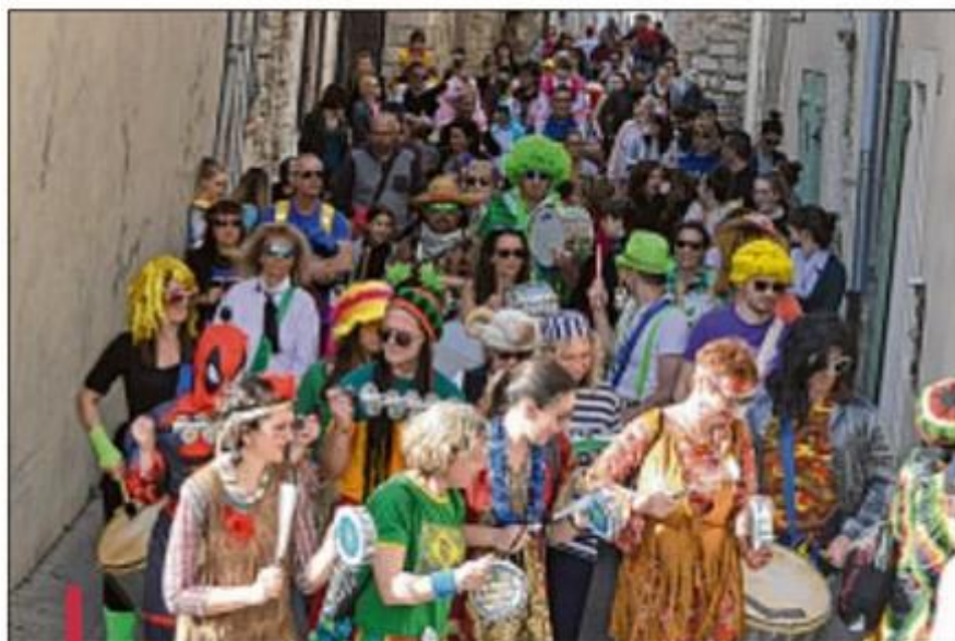
Le carnaval a défilé dans les rues du village, en musique.

maître. Ils ont avancé en dansant au son des instruments et caisses claires du groupe musical déguisé lui aussi, "Curinga", venu tout spécialement d'Aix en Provence régaler les oreilles de tous les participants. Le défilé qui représentait près de 400 participants est parti ainsi à la conquête des rues du village pour se terminer dans le hall de l'école où un goûter bien préparé attendait tous les participants.