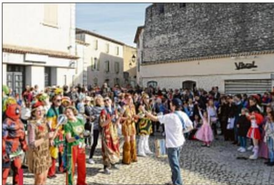
Le défilé et le groupe Curinga, sur la place du village.