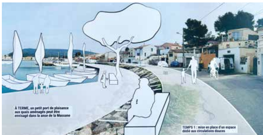
Esquisse d'aménagements d'une promenade littorale et d'un port de plaisance.

Merci de retourner ce questionnaire avant le 13 septembre en mairie (9 avenue Charles de Gaulle) ou par mail à communication@saintmitrelesremparts.fr