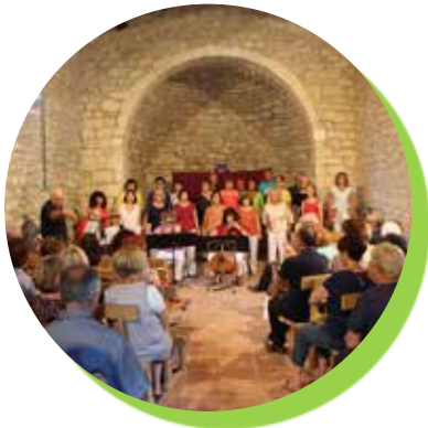
La fête de la Saint Jean avec Chante Lyre