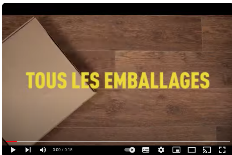
Extension des consignes de tri - été 2023

La vidéo la plus vue de l'année : www.youtube.com/watch?v=j4K01m4ulal